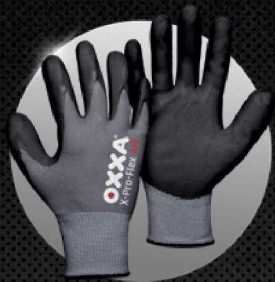
X-PRO-FLEX AIR 51-292 Art. nr. 1.51.292.00