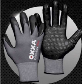
X-PRO-FLEX PLUS 51-295 Art. nr. 1.51.295.00