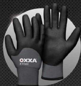
OXXA X-FROST 51-860 Art. nr. 1.51.860.00