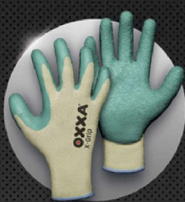
OXXA X-GRIP 51-000 Art. nr. 1.51.000.00