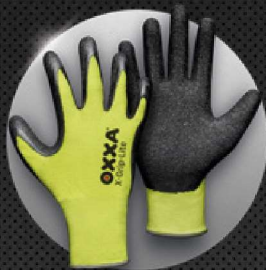
X-GRIP-LITE 51-025 Art. nr. 1.51.025.00