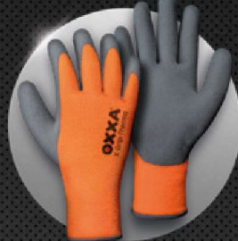
X-GRIP-THERMO 51-850 Art. nr. 1.51.850.00