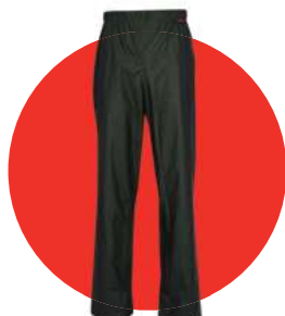
WARWICK 5300 Art. nr. 2.45.315.00