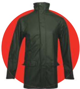
WALAKA 5200 Art. nr. 2.45.215.00