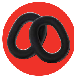
SONORA SPARE 8100