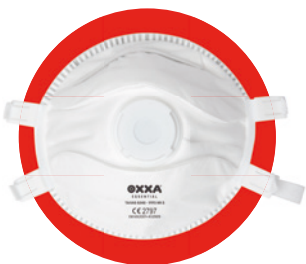
TAIVAS 6340 Art. nr. 4.05.634.00